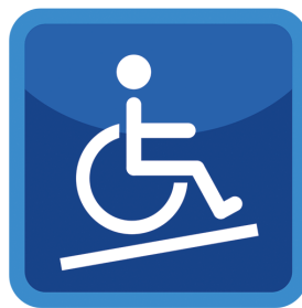
СИСТЕМЫ ДЛЯ ЛОВЗ